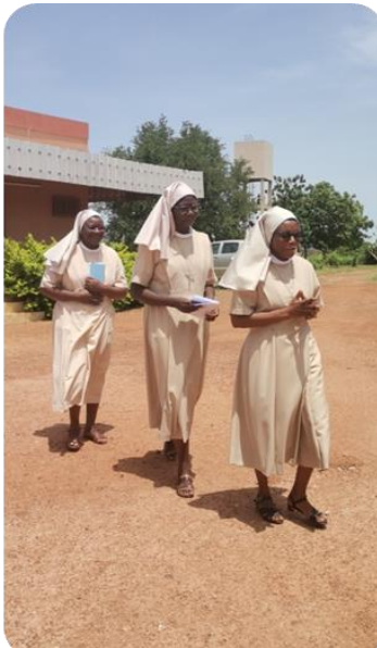
La jeune sœur accompagnée de la maîtresse et de la Supérieure provinciale.

Accompagnata dalla sua famiglia e alla presenza delle suore e del popolo cristiano e in comunione spirituale, ha fatto l'offerta della sua vita per seguire Cristo povero, casto e obbediente con la grazia di Dio e secondo le Costituzioni della Congregazione. Dopo la celebrazione eucaristica è stato condiviso nella gioia e in