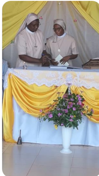
La signature du registre par la jeune sœur.

ringraziamento un pranzo per tutti i partecipanti. Il Signore fortifichi il cammino della nuova