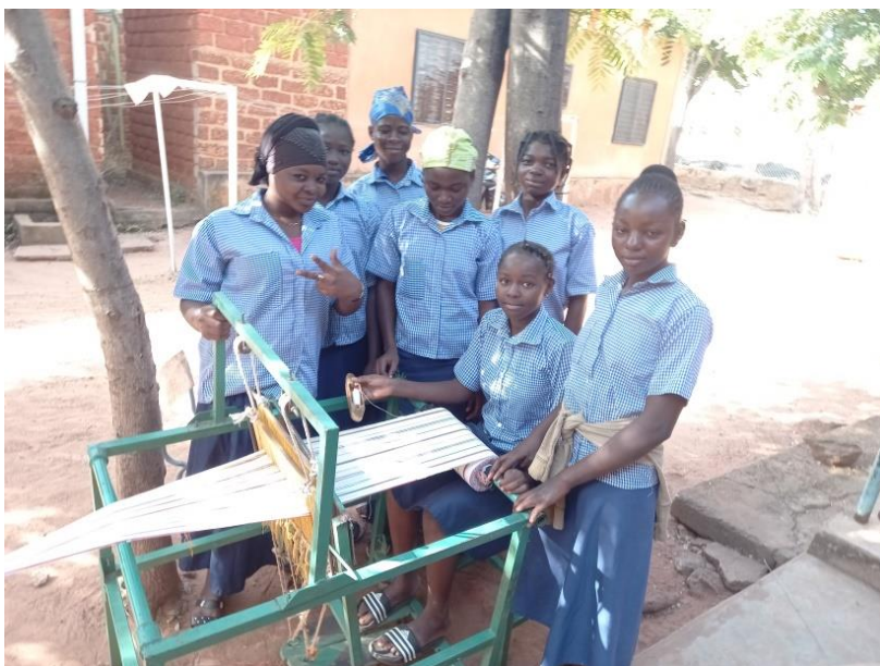
La tessitura di pagnes