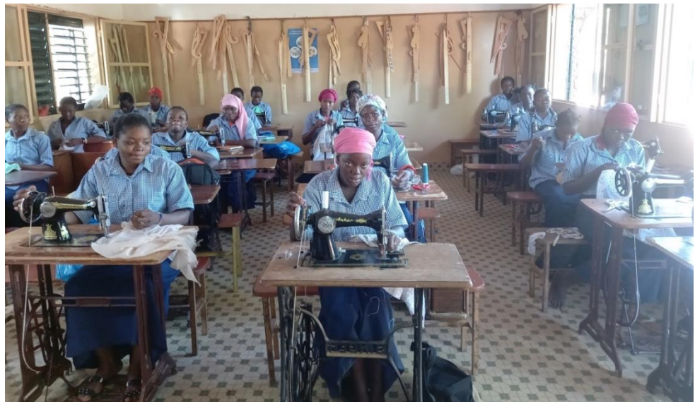
Taglio e cucito

Le attività di promozione della donna riguardano il corso di taglio e cucito