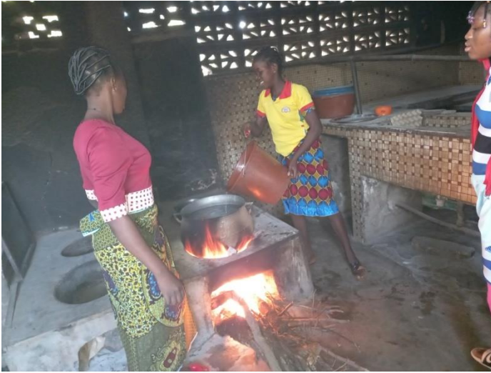
Preparazione dei pasti e del “to” una polenta