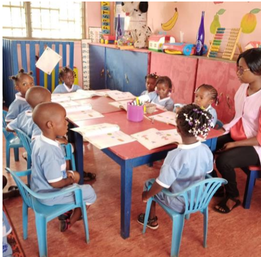
sezione dei piccoli, 33 dei mezzani e 22 dei grandi.

L'anno scolastico è iniziato il 4 ottobre con una partecipazione di 88 bambini così suddivisi. 33 della