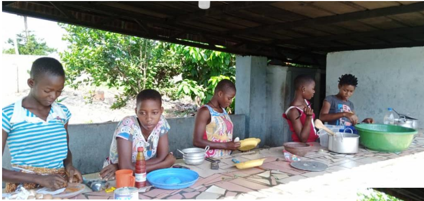
delle stoviglie e ciascuno provvede al proprio bucato.

Il foyer di Guiglo ospita 40 ragazze che frequentano la scuola media e il liceo. Qui sono rappresentati alcuni momenti della loro vita quotidiana scandita dallo studio e da altri servizi come preparare, a turno i pasti, provvedere alla pulizia degli ambienti, al lavaggio