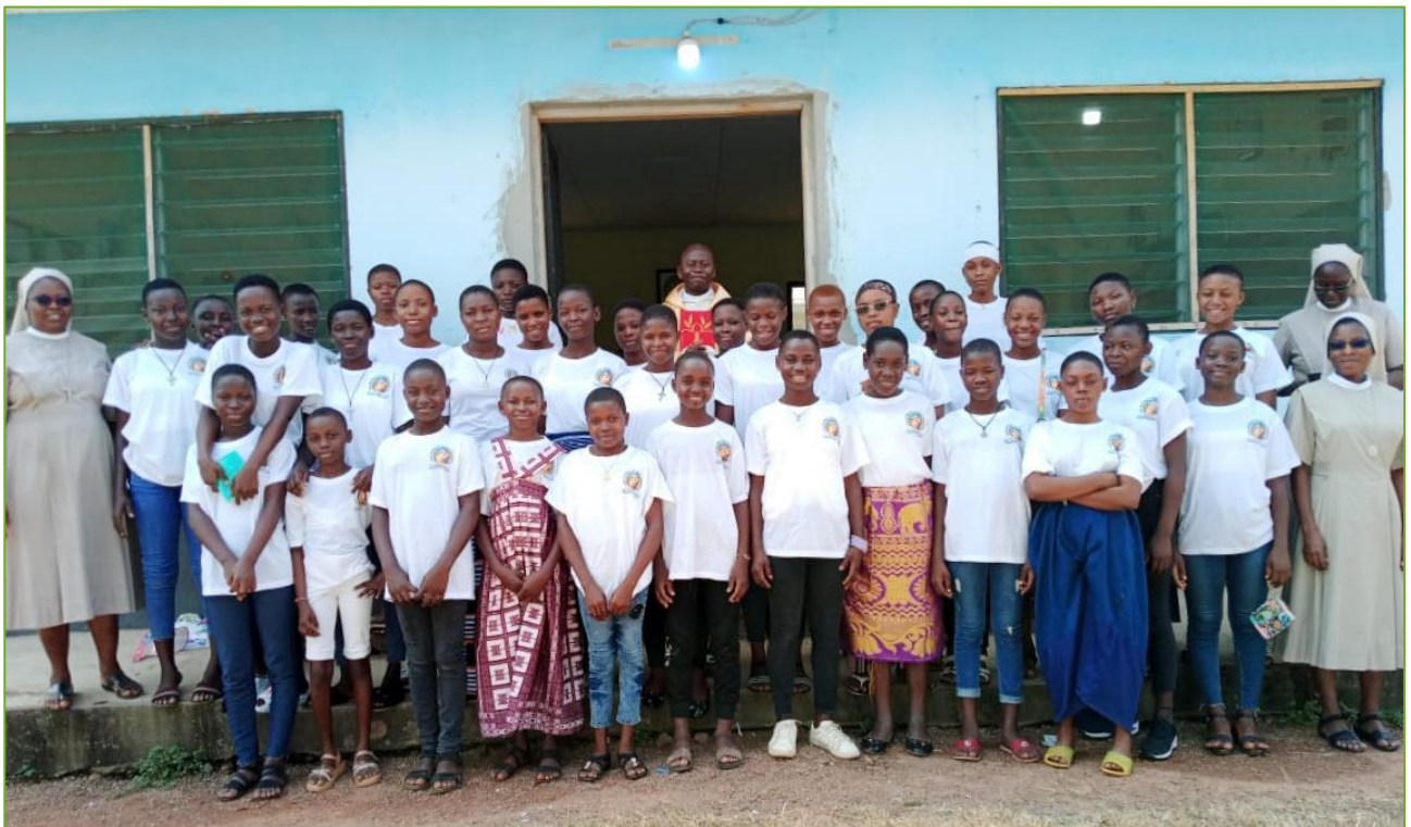
Le ragazze del foyer hanno festeggiato insieme, dopo le vacanze natalizie, partecipando alla S. Messa, e godendo di un ricco pranzo con musica e balli. Un po' di relax prima di tornare allo studio...