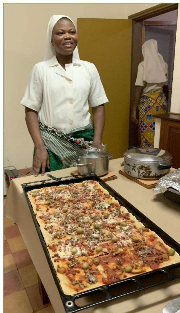
Come in altre comunità, anche qui l'accoglienza da parte delle nostre sorelle si è fatta premurosamente preparando abilmente cibi "italiani": pasta, torte, persino la pizza e la minestrina serale....