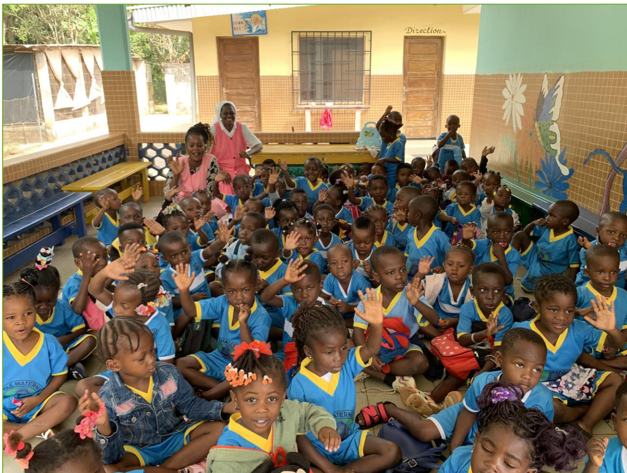
I bambini di Zagné salutano con un ciao corale e ringraziano per le caramelle ricevute

Da Zagné, il giorno 17 ci spostiamo a BLOLEQUIN . Occorre prima fare tappa a Guiglo (45 km di