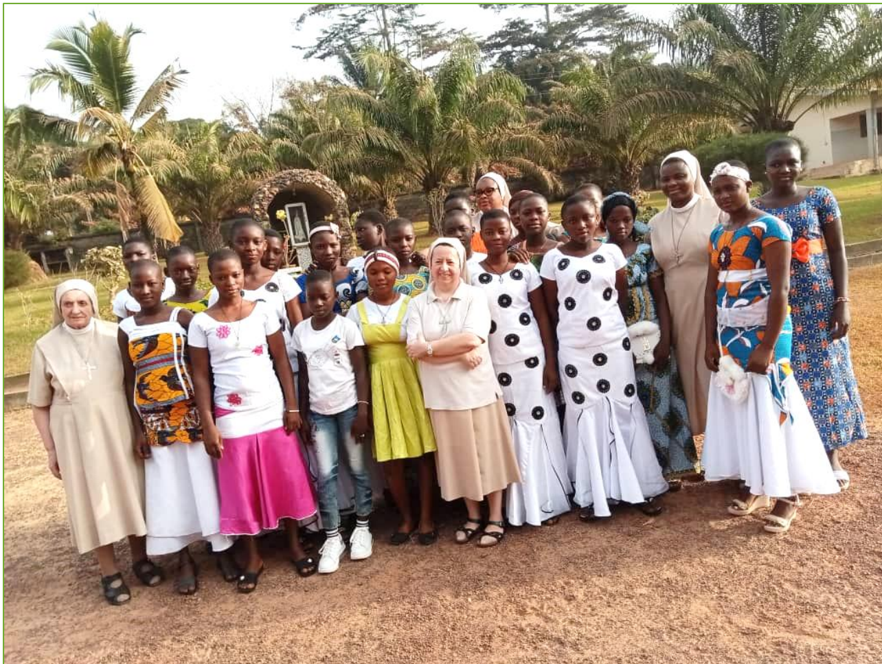
TAI - Le ragazze del foyer vestite a festa per la Messa domenicale, fra tradizione e modernità

prima della nostra partenza, quando si sono presentate vestite a festa prima di recarsi alla S. Messa in parrocchia. La somiglianza di alcuni abiti si deve ai diversi villaggi di provenienza.